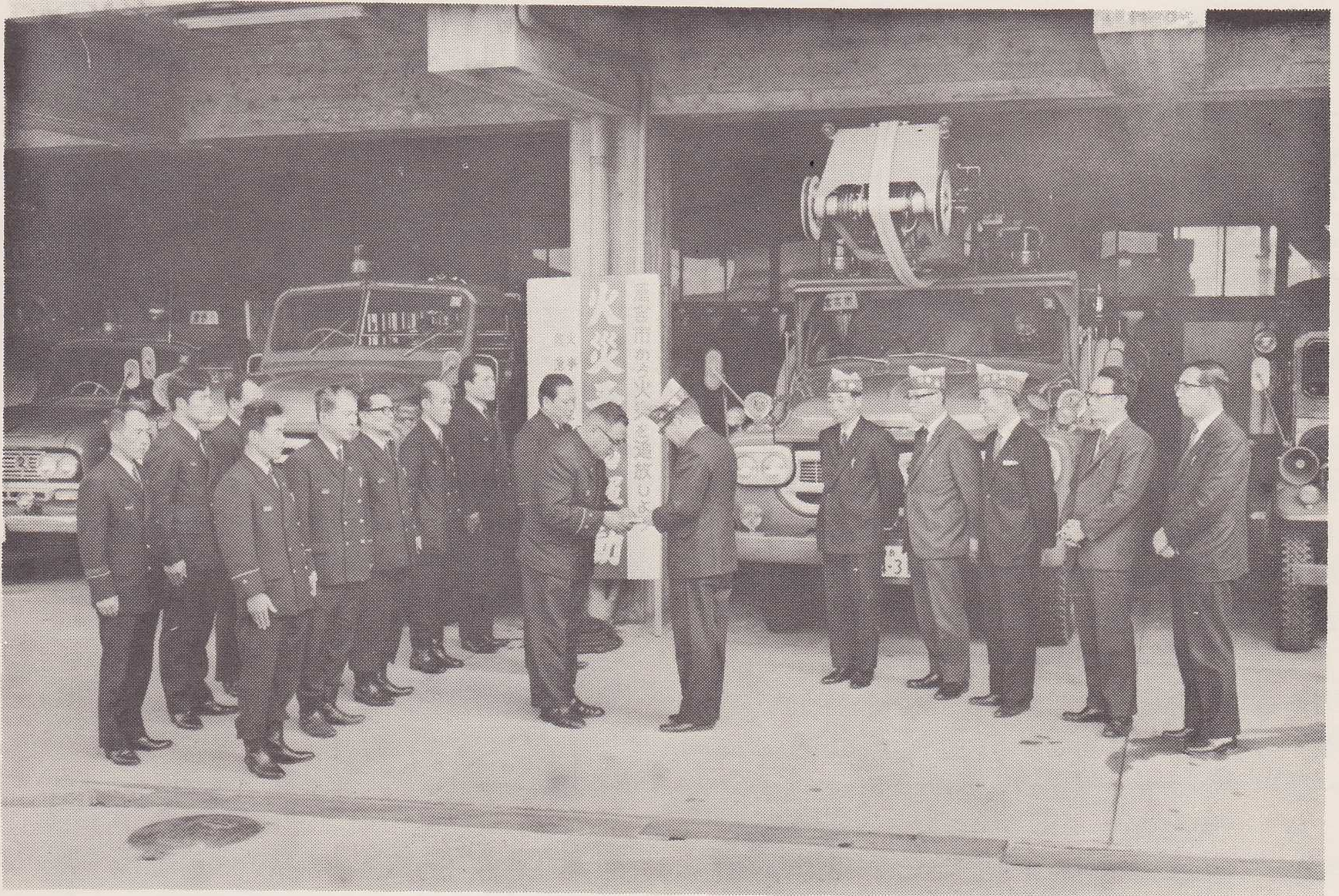
消防水利標式贈呈式 11月26日(金) 於倉吉市消防署