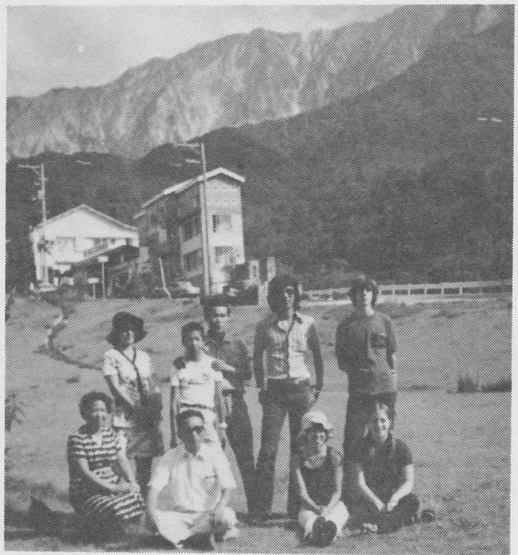
留学生と大山にて

朱の中に母親に捨てられた二人の打吹童子がいる。その下に書かれている「青少年に愛と希望を」の文字が眼にしみる。（未完）