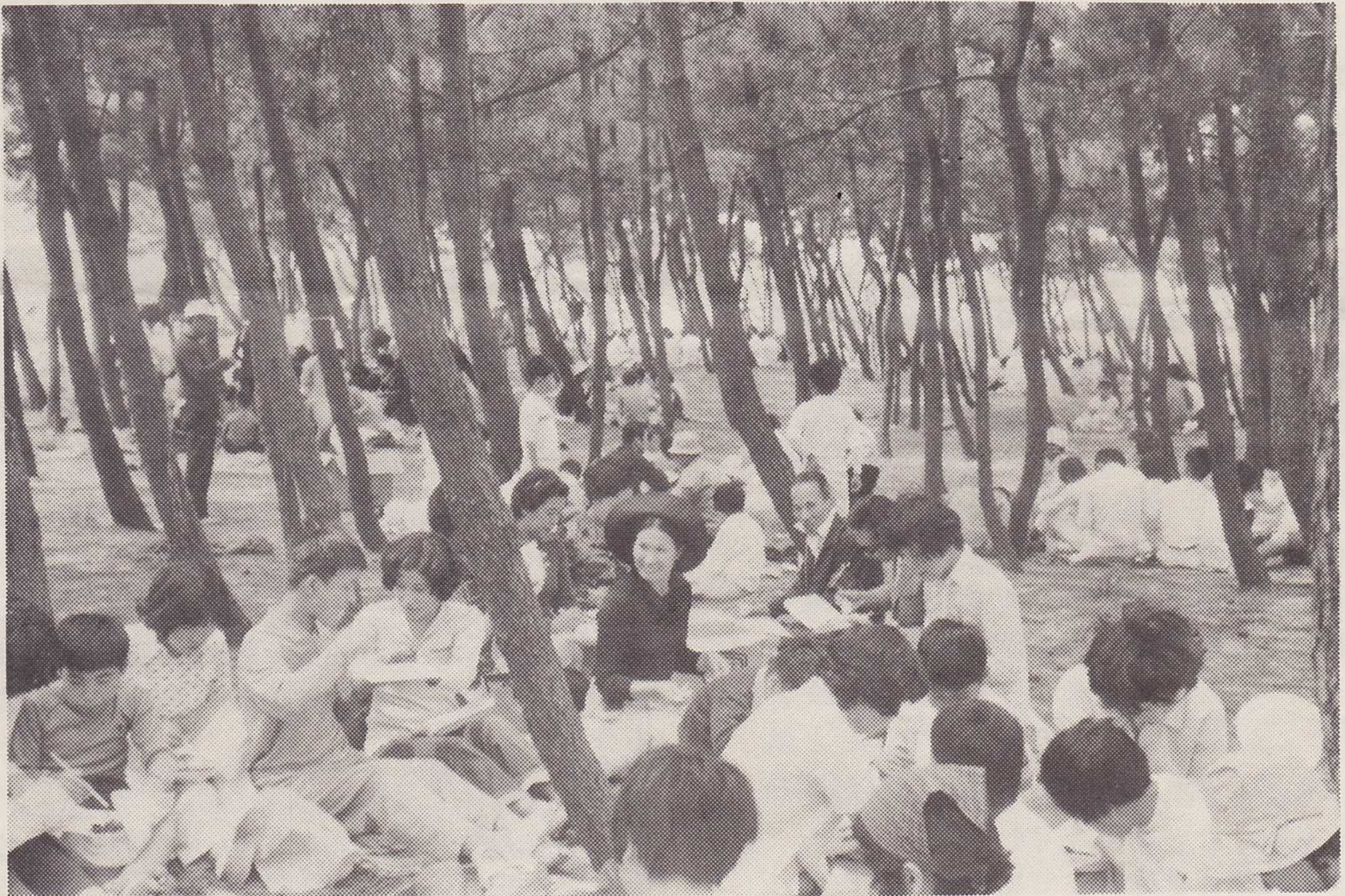
白砂青松海岸遠足