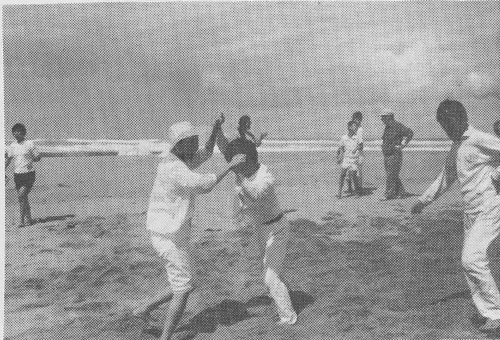
ライオンズクラブのおじさんへ

うっかり者がうっかりしていて、事務局から督促の電話あり、大変恐縮して思うままに書いていると云うことで、どのようなことを書いてよいものか当惑している次第です。ともあれ申し付け通り（表彰を受けた感想文）とのことですが、困ったなあが本音です。表彰文をもう一度読み直して見ると、（あなたは多年にわたり新生活運動の推進に尽力された業績はまことに顕著であります。よって倉吉市表彰条例第5条の規定により記念品を贈呈してその善行を表彰します）とありました。世の中には変なことが沢山あるようです。私のこの度の表彰も何かの間違いではないかと思えますけれども、受賞して何おかいわんや、実のところ新生活運動なるものの本質もわかったようでわかっていない。実のところ新生活運動とは何か、との問いに対して、生活者としての権利と義務について考えて行くという運動です。といつも私は申し上げている次第です。その中で「対話」する心が大切であることを知りました。最近各種の住民運動は、全国的に異常な昂まりをみせるようになった。それに伴って、社会の住民運動に対する関心も、また次第に大きくなってきている。このことは住民パワーといわれるように、住民の欲求や活動がもはや無視することができないほど大きな力となりつつあることを示すものであるように思われます。行政の場において、しきりに「住民との対話」が強調されるようになってきたのも、その反映であろうかと思えます。ライオンズクラブに席をおくようになってから、いつもうれしく思うことは、お互を尊敬しあい「人間を大切に考える考え方」について強調されていることに感銘を受けておる次第でございます。これからも連帯意識を益々昂めクラブの一員として恥じない人間になるための努力をして参りたいと念じております。一層のご指導をいただきますよう心からお願いいたします。表彰を受けたことは、即ち、お前はもう定年が来たぞということですが、もうすこしの間、仲間として、つきあって頂き度く重ねてお願い申し上げ終りといたします。